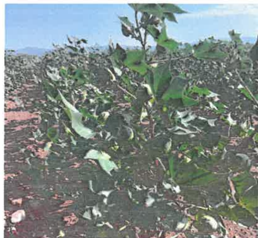
Φωτογραφίες , ΔΑΟΚ Ξάνθης (2024)